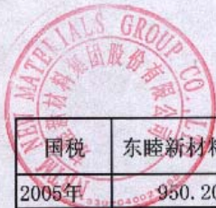
东睦新材料集团股份有限公司国、地税数据汇总清单